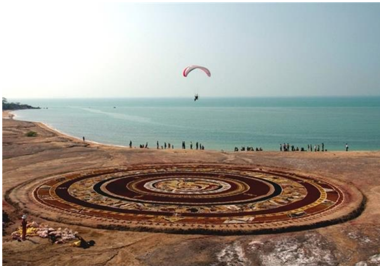
فرش خاکی، جزیره هرمز

دکتر احمد نادعلیان در سال ۲۰۰۲ موفق به کسب نشان نت‌آرت (هنر شبکه و اینترنتی) شده و در سال ۲۰۰۵ هم جایزه بزرگ و سیمرغ طلایی دوسالانه تاشکند را به دست آورده است. همچنین در سال ۲۰۰۶ به عنوان یکی از هنرمندان هنر محیطی سال در ایالات متحده و در سال ۲۰۰۹ هنرمند برگزیده موزه سبز آمریکا لقب گرفته است. نادعلیان اکنون در جنوب کشور و جزیره هرمز ساکن و آثار او در بیش از ۴۰ کشور جهان پراکنده است. احمد نادعلیان با استفاده از خاک‌های طبیعی هرمز به کمک دانشجویان یک فرش خاکی خلق کرده و در این کار از هیچ‌گونه ماشین‌آلات سنگینی استفاده نشده است.