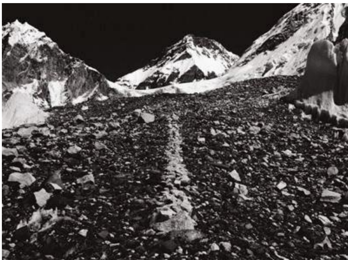
ریچارد لانگ، خطی در جزیره، ۱۹۷۴