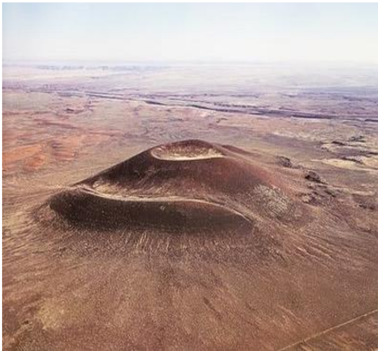
جیمز تورل، آتش فشان رادن، ۱۹۷۴، آریزونا، امریکا