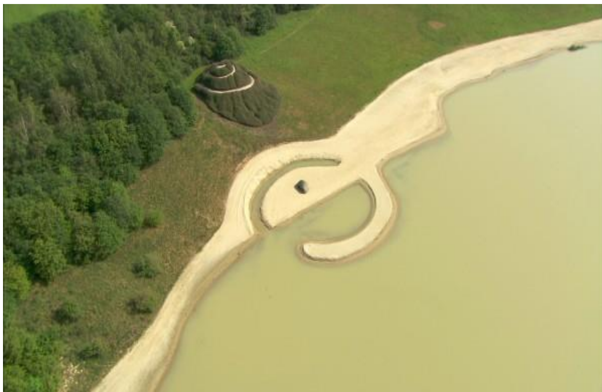
رابت اسمیتسون، دایره‌ی شکسته و اهرام، ۱۹۷۲، امن، هلند

اسمیتسون با استفاده از ماشین‌آلات و نیروی انسانی، به بازآرایی قطعه‌های بزرگ زمین می‌پردازد، توده‌های عظیم خاک را به صورت فرم‌های مجسمه‌گونه جابه‌جا می‌کند و باز به ترکیب دایره‌وار می‌رسد.