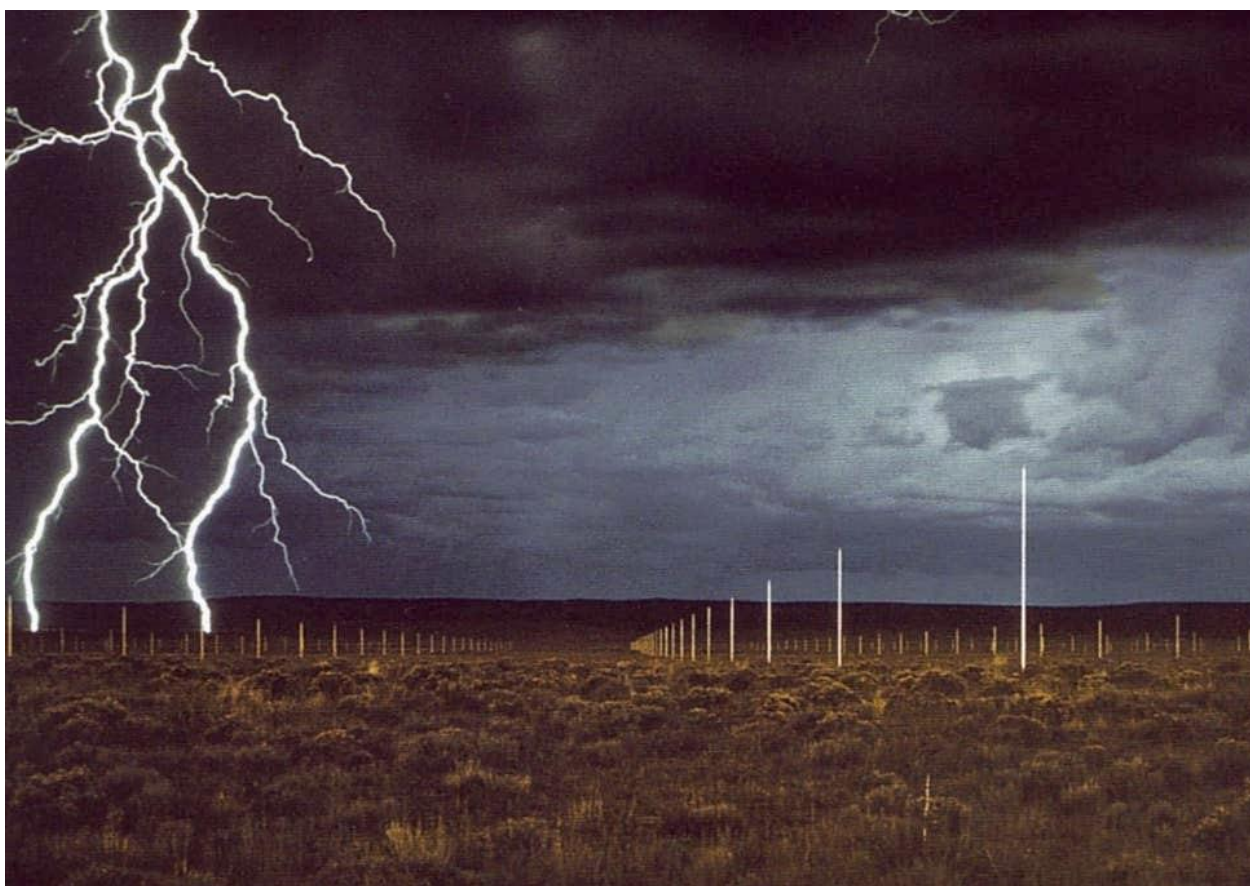
والتر دی‌ماریا، مزرعه نور، ۱۹۷۷، آمریکا

در این اثر هنری دی‌ماریا تلی از خاک را در فضای گالری می‌ریزد و امکان ورود به گالری از بین می‌رود. نوعی از دادائیسم ایف کلاین در این اثر دیده می‌شود. کلاین مخاطب را به گالری خالی دعوت می‌کند، او نیز به یک گالری دعوت کرده که به دلیل شرایط ایجاد شده، نمی‌شود داخل آن شد. این اثر به نوعی دهن‌کجی هنرمندان لند آرت به گالری‌هاست. این ویژگی که از یک جا کردن و به یک جا آوردن و یا به عبارت دیگر جایگزین کردن دو فضا نیز در این اثر اتفاق می‌افتد.