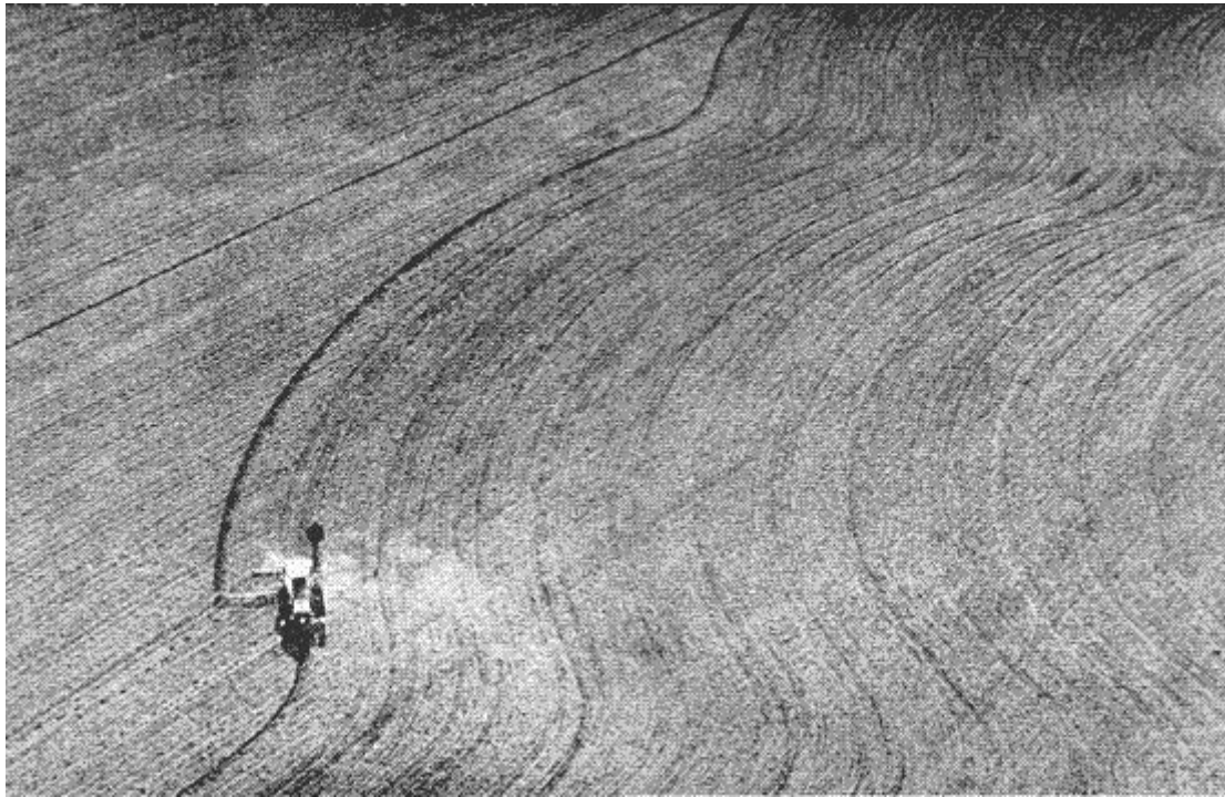
دنيس اوپنهايم، بذر افشانی جهت داده شده، ۱۹۶۹، هلند

هنرمند قسمتی از مزرعه را با طراحی قبلی به طور خاصی شخم می‌زند و آرایش جدیدی به وجود می‌آورد. عکس ثبت شده را برش می‌زند و این کار به دست می‌آید.