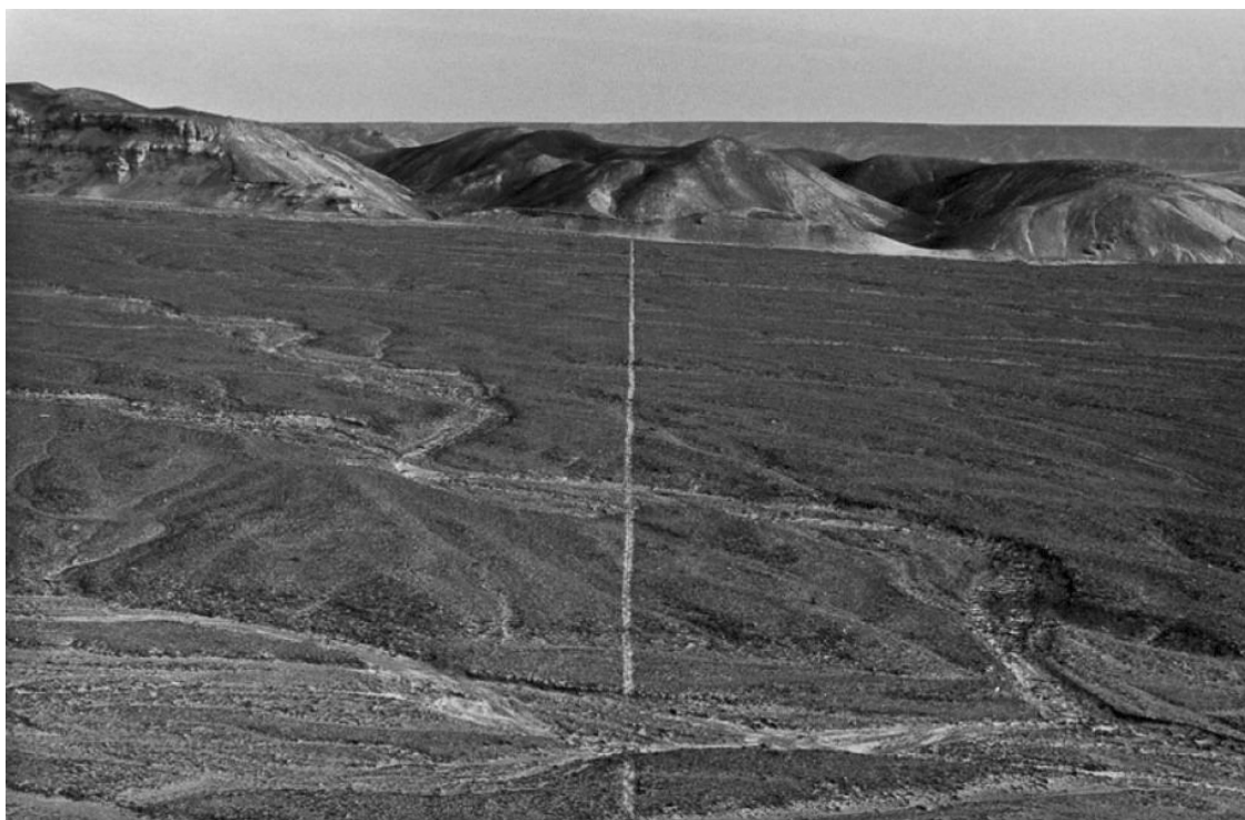
ریچاردلانگ، راه‌پیمایی روی یک خط، ۱۹۷۲، پرو