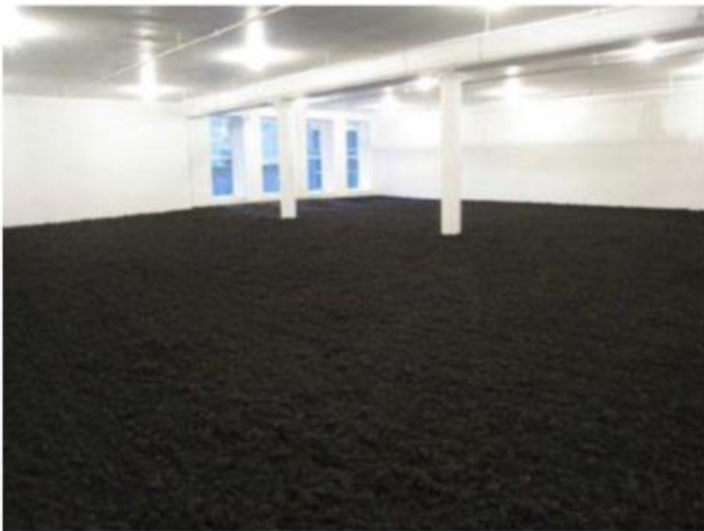
والتر دی‌ماریا، پنجاه متر مکعب خاک، ۱۹۶۸، نیویورک