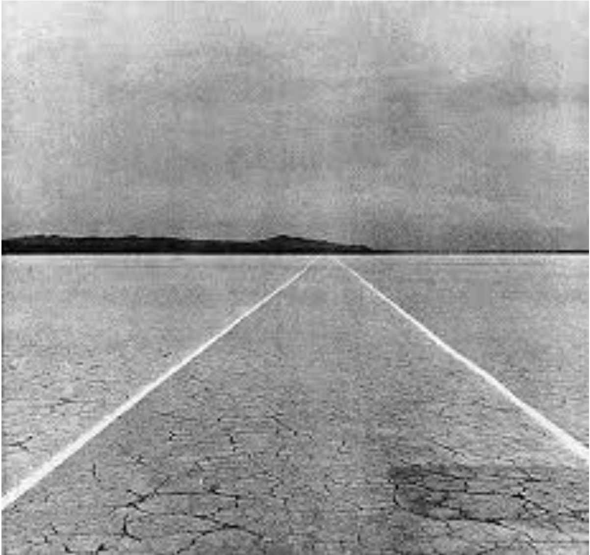
والتر دی‌ماریا، دو خط موازی، ۱۹۶۸، صحرای موجیو، کالیفرنیا، طراحی به طول یک مایل، فاصله دو خط ۳/۶۶ متر

برای دیدن اثر باید در آن مکان با امکانات ویژه و ایمنی کامل منتظر باشید، با امید به این که رعد و برق بزند و شما اثر را ببینید. عنصر ناپایداری که لند آر티ست‌ها دنبالش بودند در این اثر دیده می‌شود.