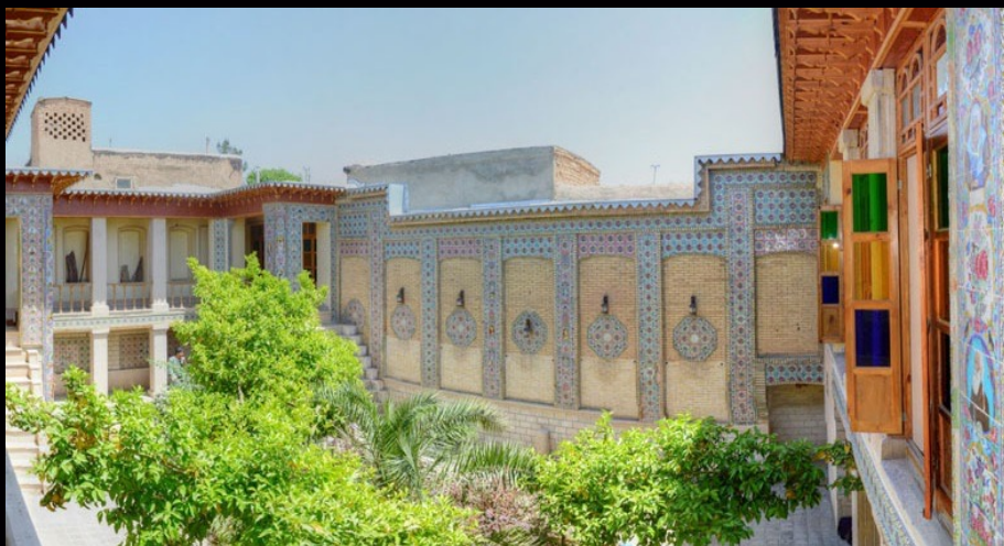
خانه ضیائیان شیراز

معماري سنتي ايران از جنبه هنري، پيشينه اي بس ديرينه دارد. معماري سنتي در ايران به لحاظ نوع جغرافيايي آن با خاک عجيب است و اين خاک براي ساخت بناها مورد استفاده قرار مي گيرد و با رنگهاي که به گونه هاي مختلف بر آن زده مي شود جان مي يابد و زنده مي شود .